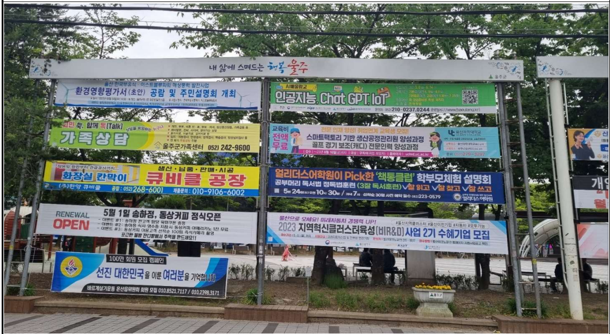
울산광역시 울주군 온산읍(덕신소공원 앞)