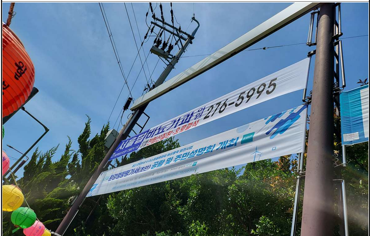
울산광역시 동구(방어동 903-2 LPG 충전소 맞은편)