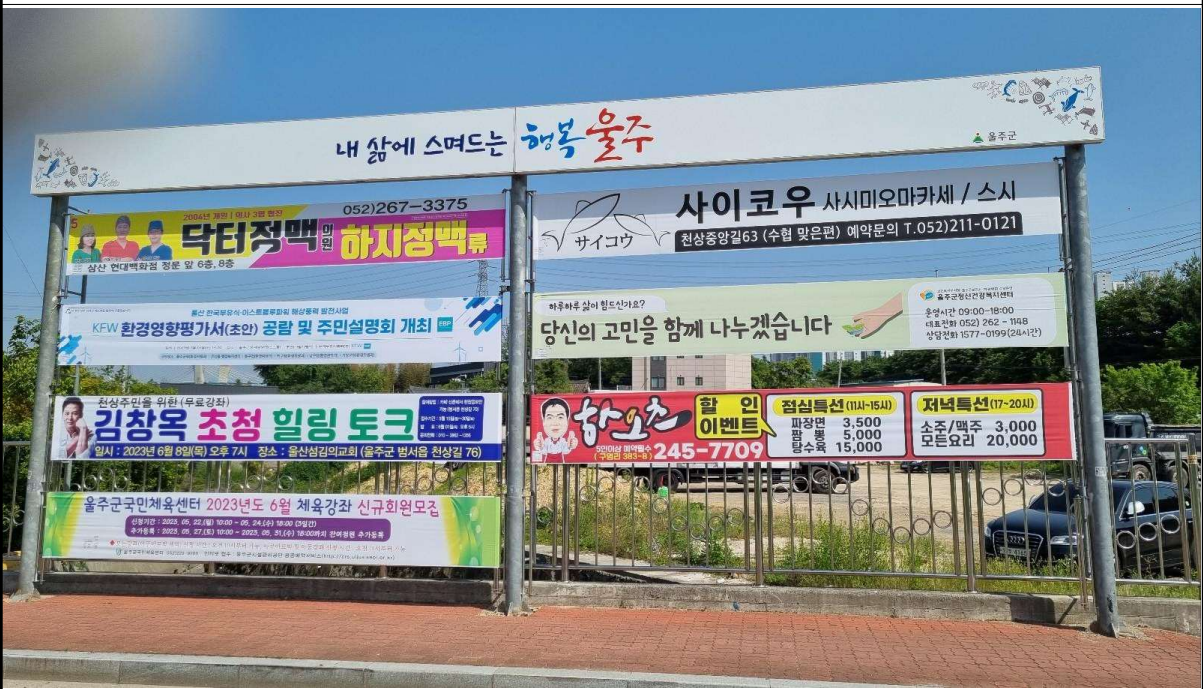
울산광역시 울주군 범서읍(백천마을 입구)