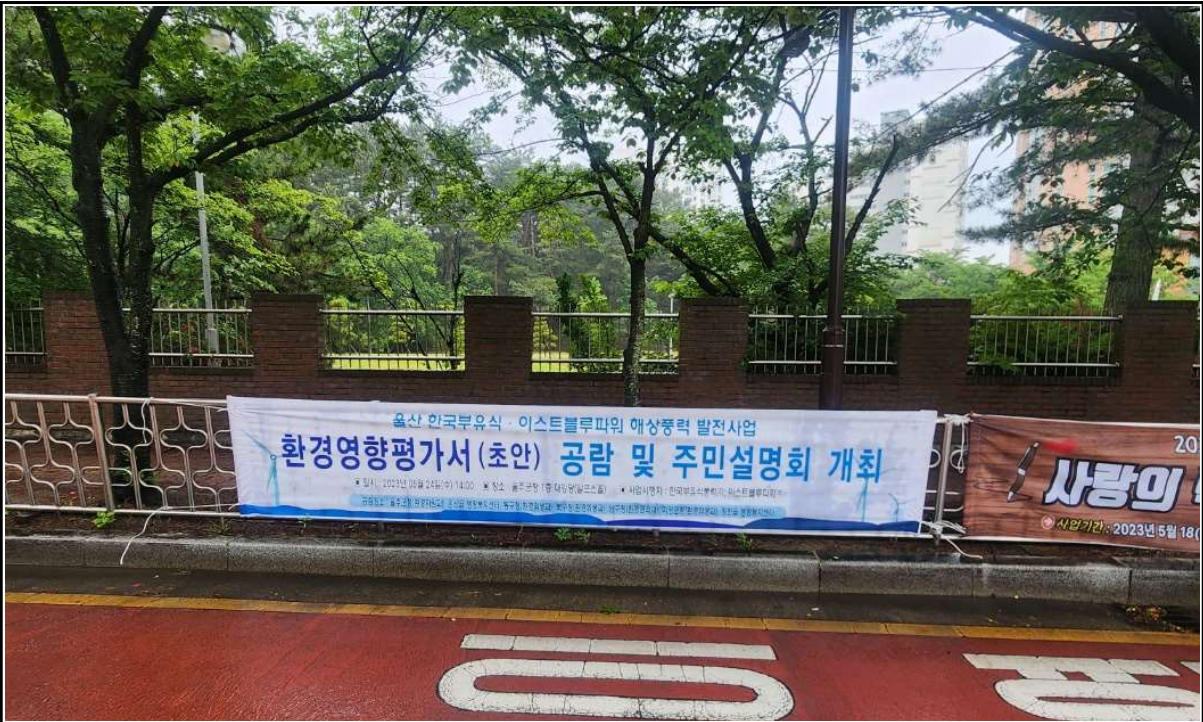
울산광역시 울주군 온산읍(행정복지센터 앞)