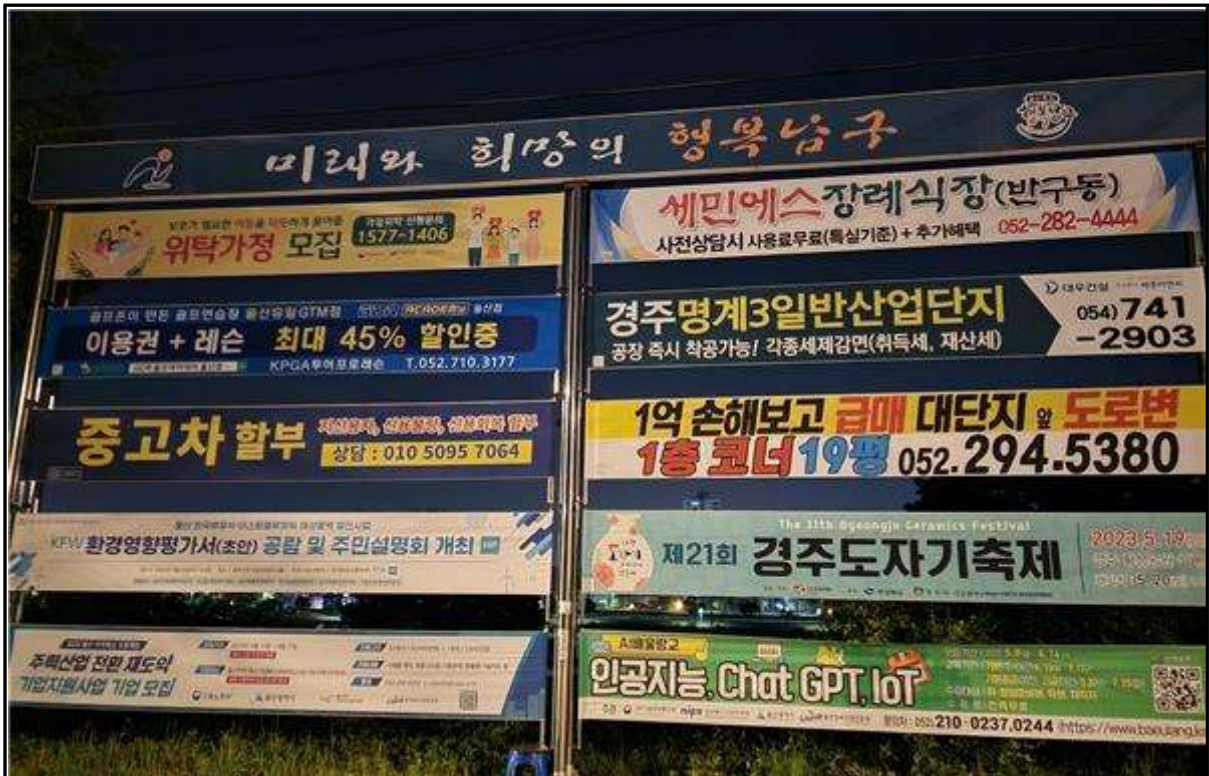
울산광역시 남구(남부소방서 맞은 편)