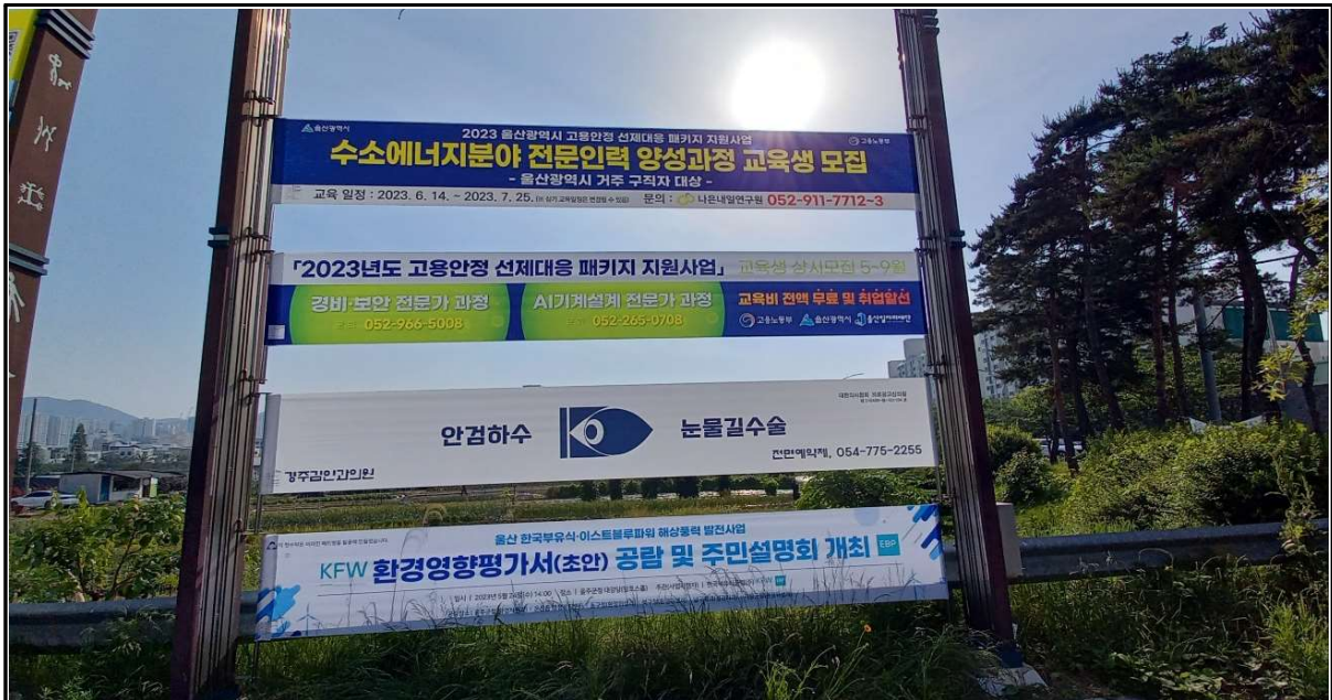
울산광역시 북구(울산공항교차로, 북구 송정동 1140)